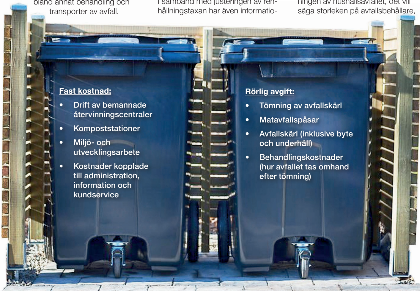
Det ingår flera delar i renhållningstaxan, som ska täcka utgifterna för hanteringen av hushållsavfall.

Kostnaden för kommunens renhållningsverksamhet finansieras via avgifter. Den rörliga delen utgörs av kostnader förknippade med hämtningen av hushållsavfallet, det vill säga storleken på avfallsbehållare,