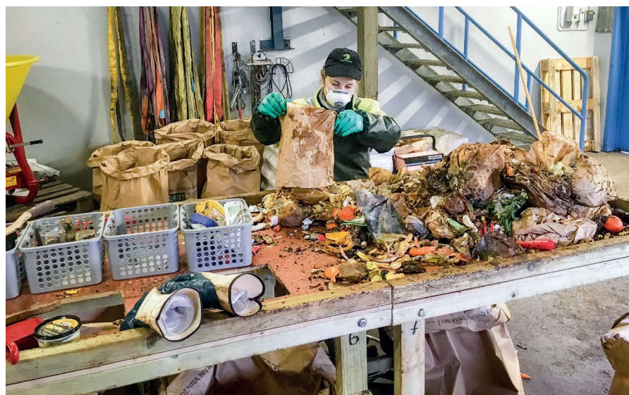
Metall, plast, grus, jord, glas och batterier hör inte hemma bland matavfallet utan ska sorteras i rätt fraktioner.

Rätt sorterat matavfall är en värdefull resurs i produktionen av förnybart drivmedel och biogödsel. Med fyrfackssystemet Maximiljö är det lättare att sortera matavfallet. Det visar undersökningar som VMAB har låtit göra.