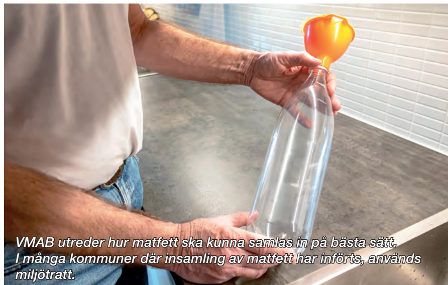
VMAB utreder hur matfett ska kunna samlas in på bästa sätt. I många kommuner där insamling av matfett har införts, används miljötratt.