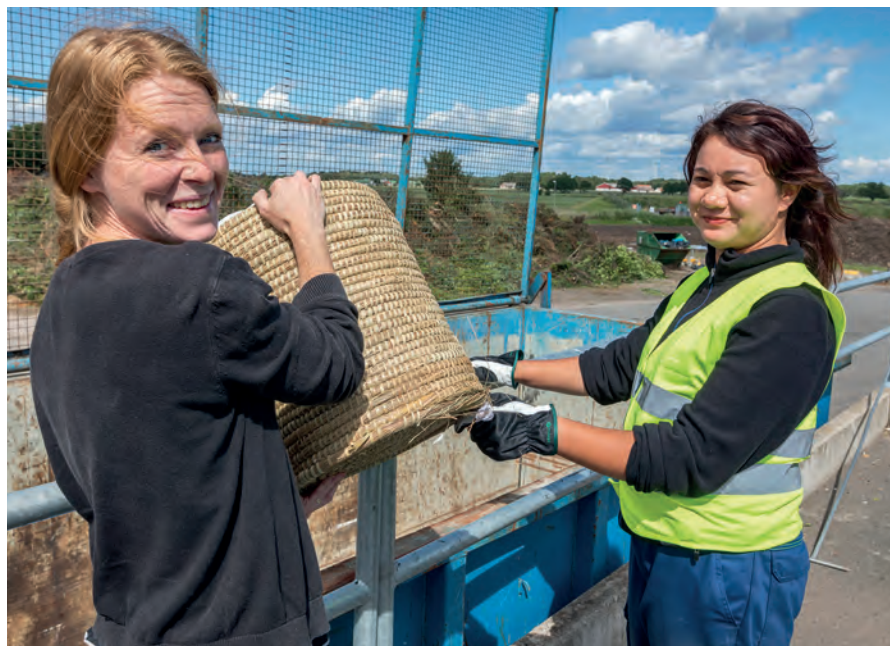
VMAB har lyssnat på kundernas förslag om hur avfallshanteringen kan förbättras. Söndagsöppet på återvinningscentralerna är ett av önskemålen från hushållen som VMAB har tagit till sig och satsat på.